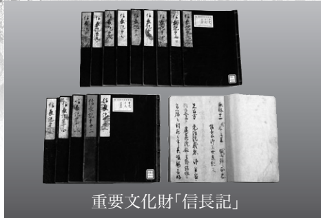
重要文化財「信長記」